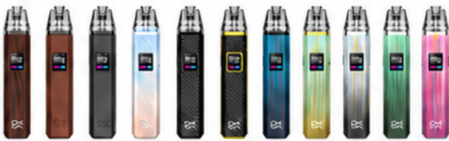
Brown Wood Brown Leather Gray Fancy Silver Black Feather Black Gold Creamy Blue Creamy Cyan Creamy Gray Creamy Green Creamy Red