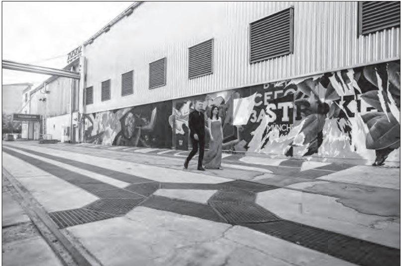
Duo Dauenhauer Kuen