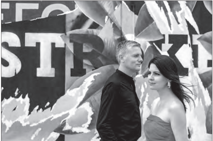
Duo Dauenhauer Kuen