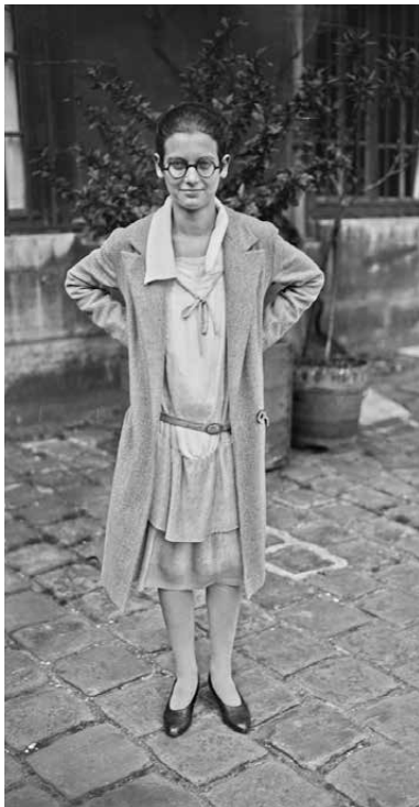
Elsa Barraine (1928) at just 18 years old, during her victory in the 2nd Prix de Rome.