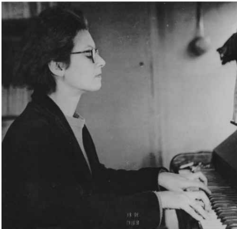
Elsa Barraine, ca. 1940