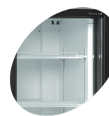
Lodrät invändig lampa