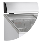
Belyst displayskiva som tillval (tillbehör)