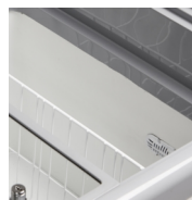
Vit invändig pulverlackering