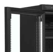
LED-lampa inuti dörramen