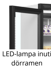
LED-lampa inuti dörramen