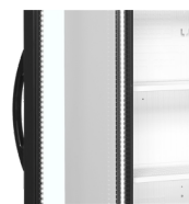
Glasdörr med gångjärn till vänster