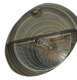
Invändig fläkt och korg