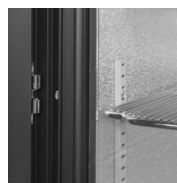
Dörrhållare för insättning i skåpet