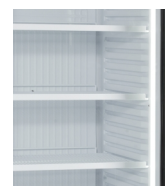
Lodrät invändig lampa