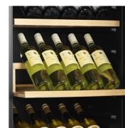
Presentationshyllor finns som tillval