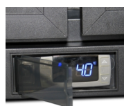
Skyddshölje på termostat