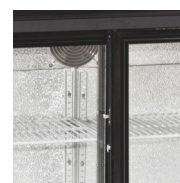
Dörrhållare för insättning i skåpet