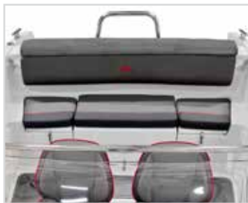
Komplett dynsats fram och bak.