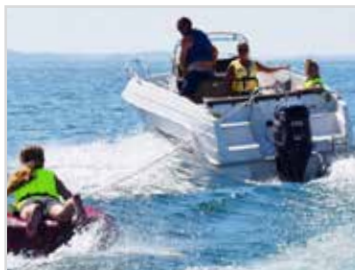
Vattenskidbåge En rejäl vattenskidbåge för vattensportsaktiviteter. Rostfri.