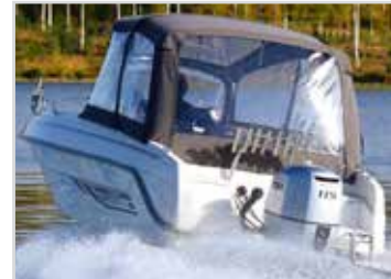
Akterkapell som går att använda helt eller delvis uppsatt. Kontakta återförsäljare för pris.