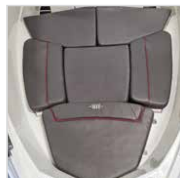
Solbädd lläggsskiva samt dyna. Kontakta återförsäljare för pris.