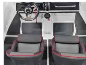
Softfloor Kontakta återförsäljare för pris.