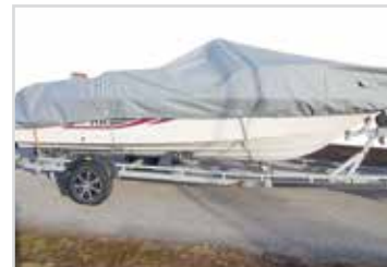
Transport/ förvaringskapell Kontakta återförsäljare för pris.