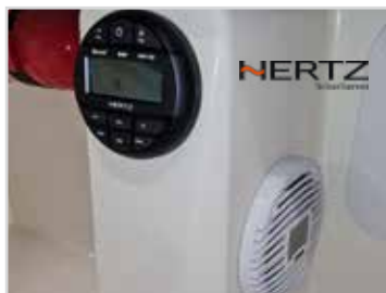
Stereo från Hertz Marine Bluetooth.