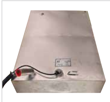
Fast tank på 170 liter.