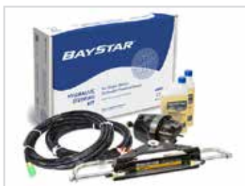
Hydraulstyrning från Baystar Plus.