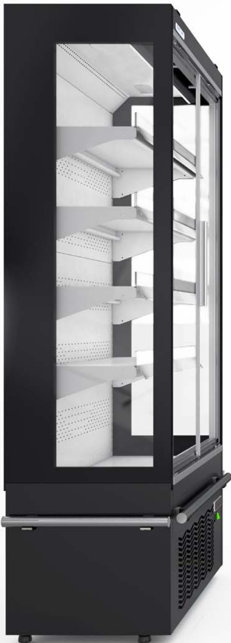
EYRE ND PM203452BD

TDA 2 : APERTURA TOTAL DE EXPOSICIÓN CON LATERALES / TOTAL DISPLAY AREA WITH GABLE ENDS / SURFACE TOTALE D'EXPOSITION AVEC JOUES / GESAMTDISPLAYLLCBE MIT SEITENTEILE