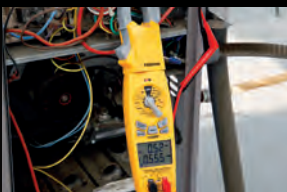
ELMÄTARE OCH TILLBEHÖR