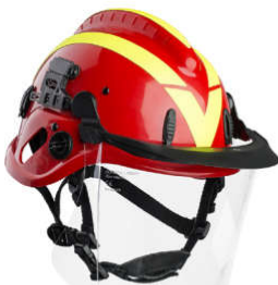
PC langt visir