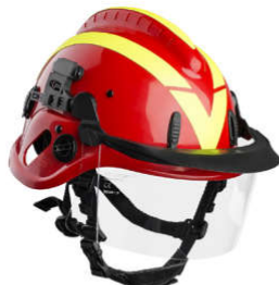
PC kort visir