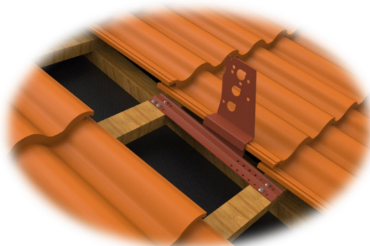
Läs monteringsanvisning, bild visar reviderad version 6132