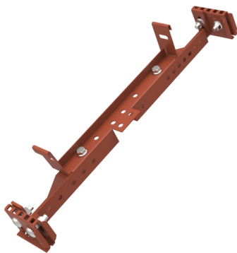
Komplett stegfäste dbi fals 6118