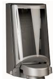
Silver de Luxe Art nr 3553