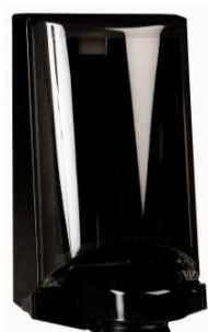
Svart Art nr 3552