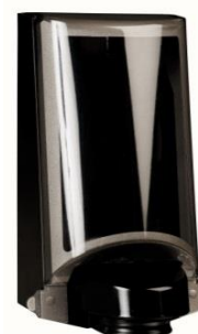
Black de Luxe Art nr 3554