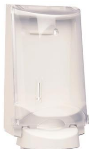
Vit Art nr 3551