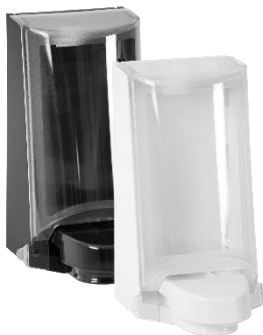
Art. nr 4552 / 4551