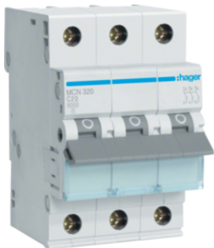
Dvärgbr C 3-P 20A 6kA