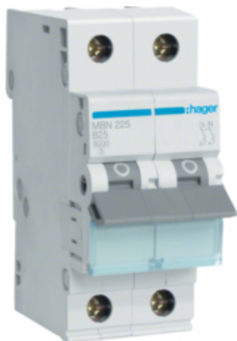
Dvärgbr B 2-P 25A 6kA