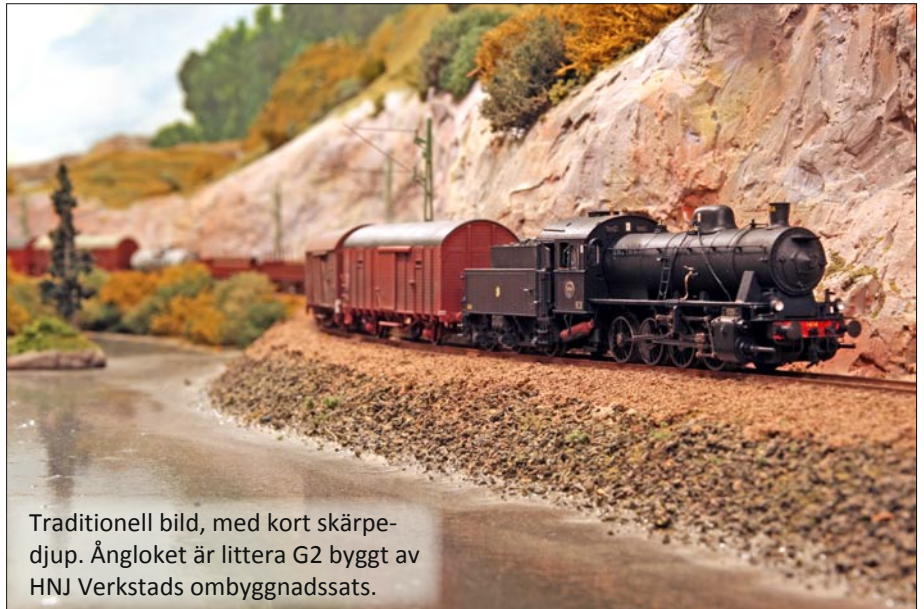
Traditionell bild, med kort skärpedjup. Ångloket är littera G2 byggt av HNJ Verkstads ombyggnadssats.

Hur många bilder skall jag ta? Det beror på hur stort djup du har i bilden och vilken bländare du valt. Har du till exempel valt att använda bländare 8 får du ta några fler bilder än om du väljer bländare 11. Du bör ta 5–10 bilder. Testa dig fram. Programmen klarar att sätta samman flera hundra bilder så där finns ingen begränsning.