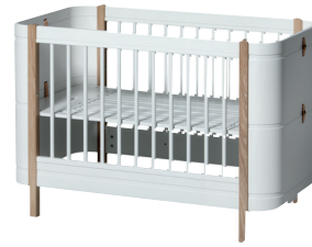
First sleep Premier sommeil