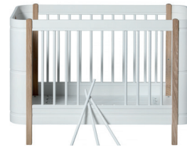
Shortcut Petite sortie