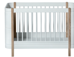
Learn to sleep Apprendre à dormir